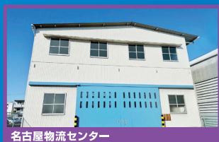
名古屋物流センター