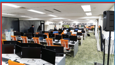
本社 (岡山オフィス)