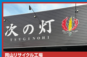
岡山リサイクル工場