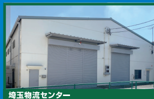
埼玉物流センター